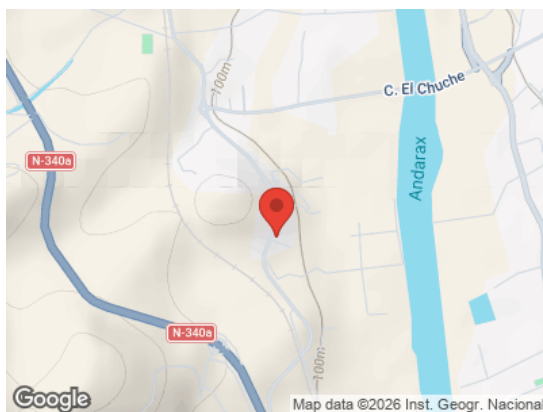
Map data ©2026 Inst. Geogr. Nacional Vista General (Terreno)