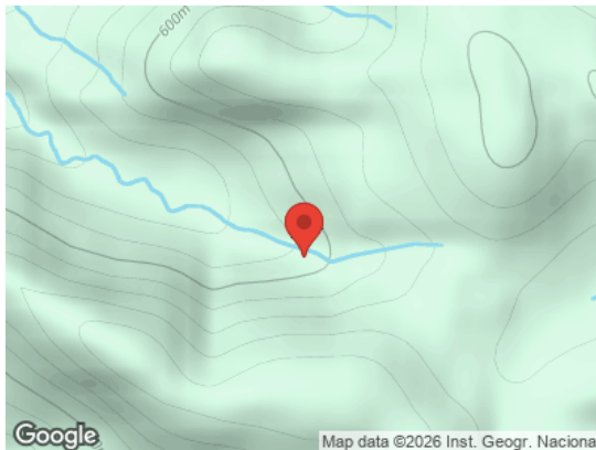
Map data ©2026 Inst. Geogr. Nacional Vista General (Terreno)